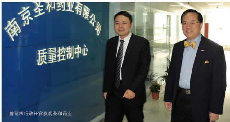
曾荫权行政长官参观圣和药业

【本报讯】2010年4月28日上午，圣和集团迎来了尊贵的客人，香港特别行政区行政长官曾荫权先生和夫人曾鲍笑薇女士在省政府副秘书长肖泉的陪同下莅临我公司新港生产基地参观。